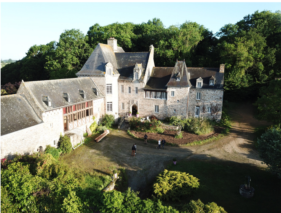
Le Château de Brévidy