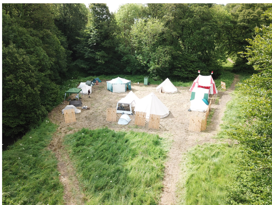
une des expéditions à Tamendil

10) On est hyper sympas, très charismatiques, évidemment professionnels, extrêmement intelligents, humbles (sauf l'orga chargé de communication).